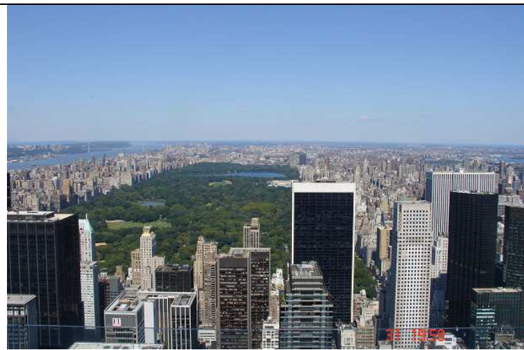
Pohled z GE na Central Park (341 hektarů), který se nachází přesně uprostřed Manhattanu