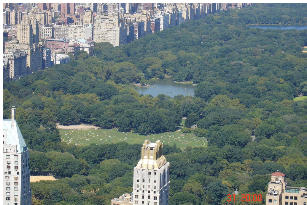
Newyorčani se v Central Parku pěkně opalují (a u toho papají hamburgery ☺) a my jdeme do půjčovny pro autíčko na náš dlouhý výlet....