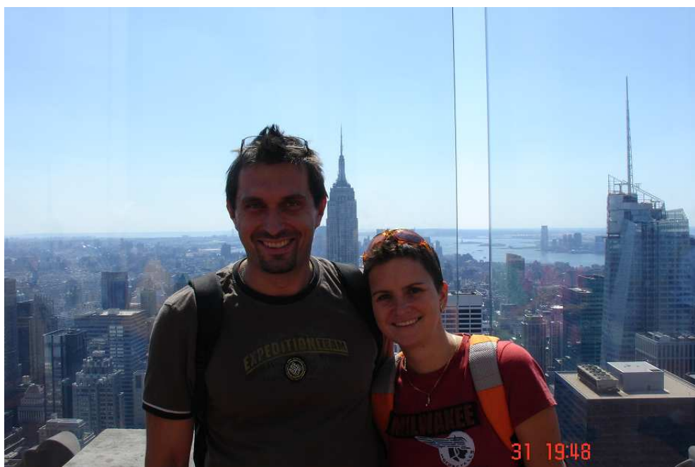
Výhled z budovy GE v Rockefellerově centru. Mezi námi vykukuje Empire State Building, nejvyšší budova v New Yorku (necelých 450 metrů, 102 pater)