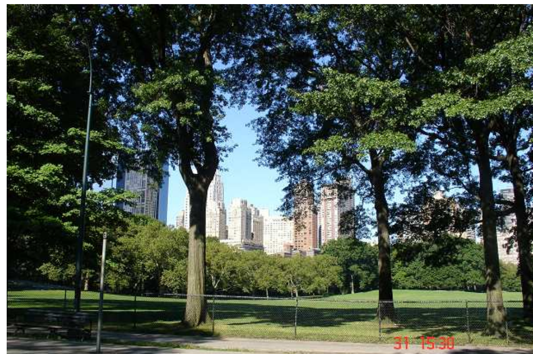
New York: Central Park

Ale teď už k našemu poslednímu dni v New Yorku. Dopoledne jsme si udělali krásnou procházku částí obrovského Central Parku. Po obědě jsme vyjeli výtahem na budovu GE v Rockefellerově centru. Cesta nahoru výtahem se nám moc líbila – zhaslo světlo, strop výtahu se rozsvítil modře a bylo skrz něj vidět do osvětlené cihlové výtahové šachty, jak rychlostí frčíme směrem nahoru. Nahoře se dveře výtahu otevřely a paní černoška nás uvítala: Welcome to the Top of the Rock!