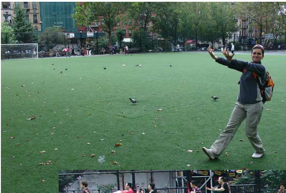
Vítání slunce s místními obyvateli ☺