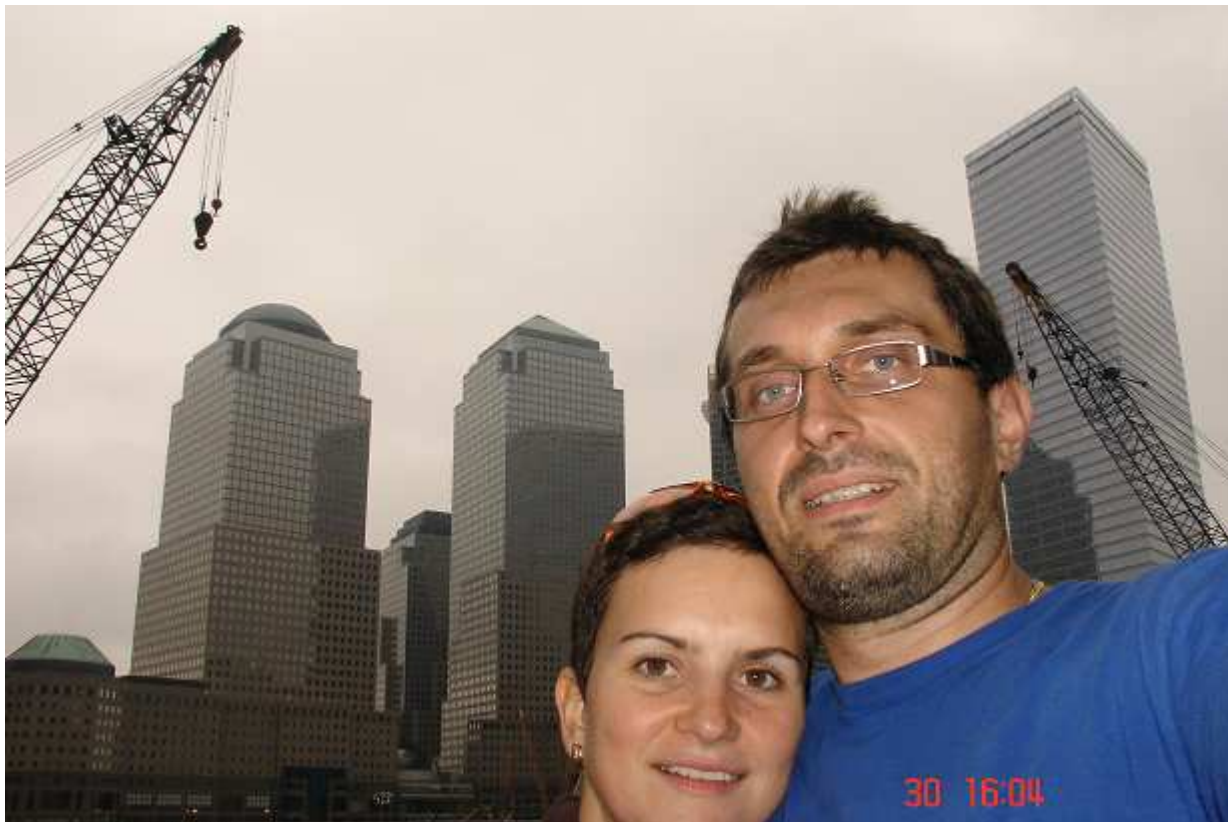
U světového obchodního centra (WTC), za námi mezi jeřáby díra po dvojčatech.