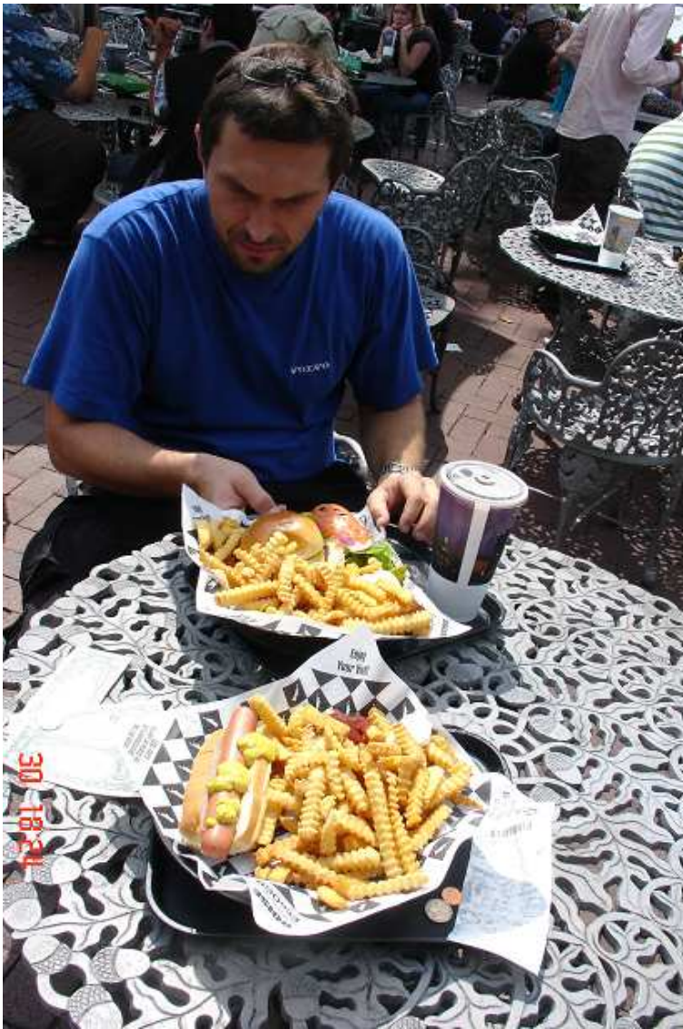
Lehký americký oběd pod Sochou svobody ©