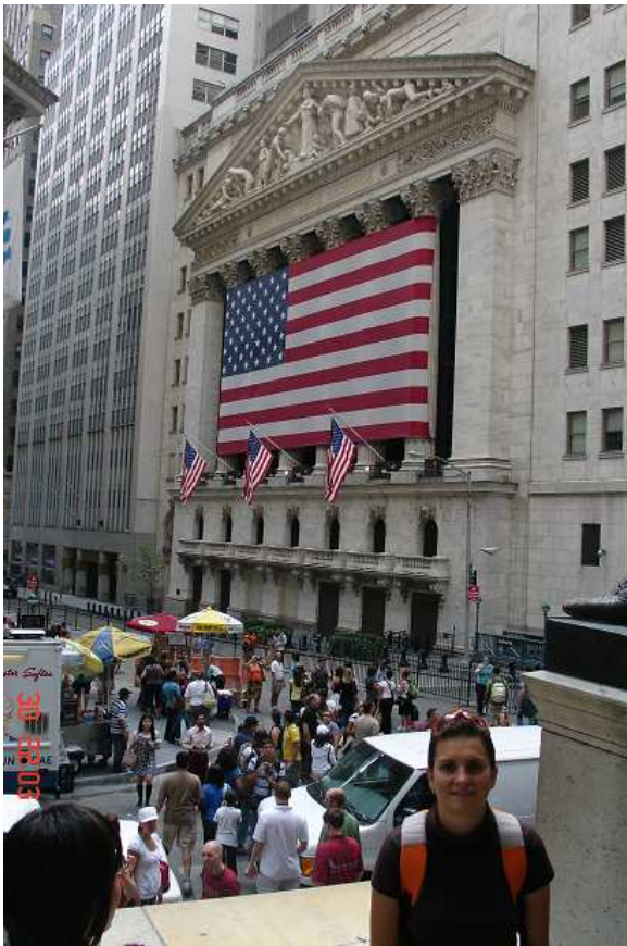
Newyorská burza cenných papírů – New York Stock Exchange