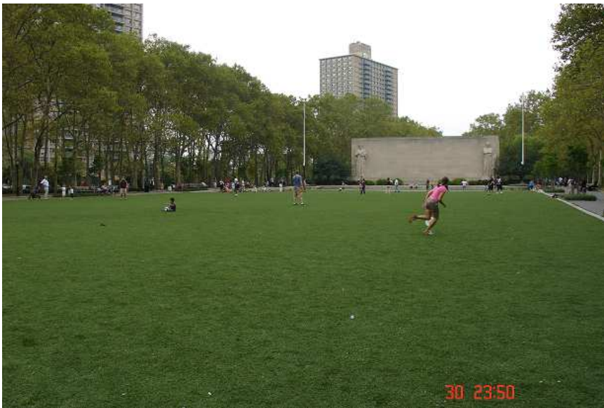
Brooklyn – čtvrť v Njū jorku ☺ se nám po šíleném shonu na Manhattanu moc líbila. Je tu obrovský zelený park (s umělým trávníkem) a krásné tiché stinné uličky s cihlovými domy.