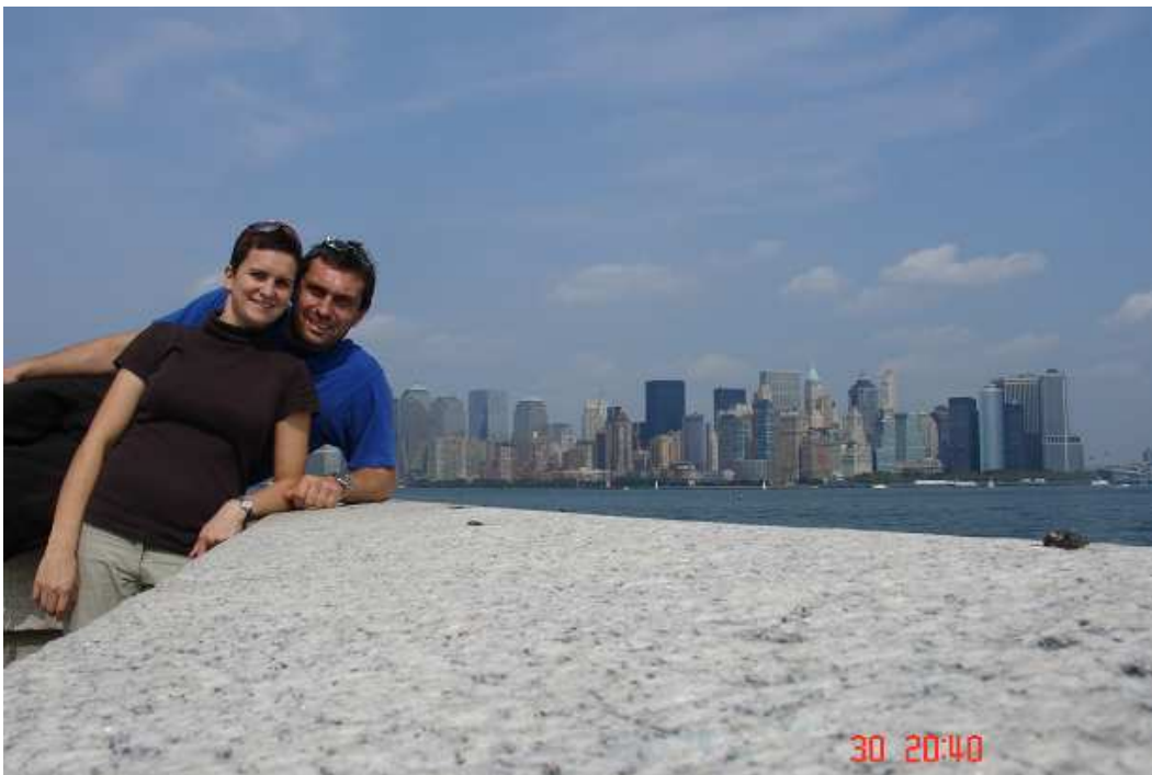
Pohled na jižní Manhattan z ostrova imigrantů Ellis Island Ellis Island byl hlavním sídlem imigračního úřadu v letech 1892 – 1954. Prošlo tudy více než 12 milionů lidí.