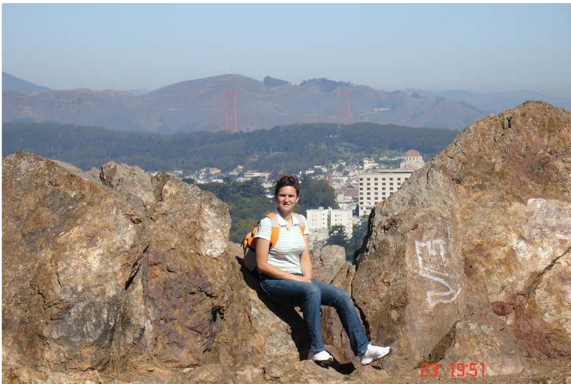
V pozadí Golden Gate Bridge