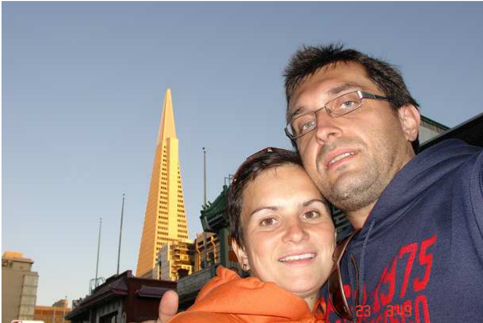
Nejvyšší budova San Franciska – štíhlý jehlanovitý mrakodrap Transamerica Pyramid Building.