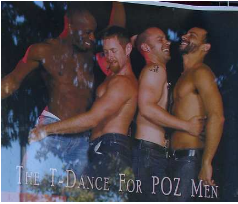
Pozvánka na super mejdlo v ulici Castro...