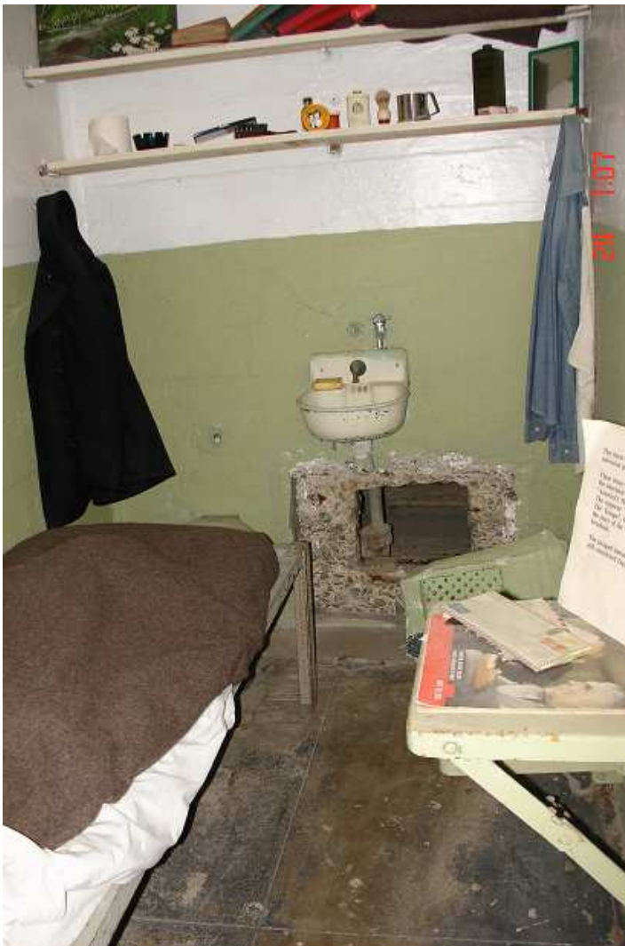
Cela jednoho ze tří uprchlých vězňů. Díru ve větrací šachtě vydlabali vězni lžícemi, které se později v cele našly.