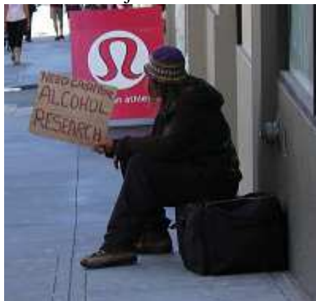
Přispějte mi na alkoholický výzkum ☺.

Bezdomovců je na Market Street tolik, že musí mezi sebou soupeřit o nejzajímavější způsob žebrání.