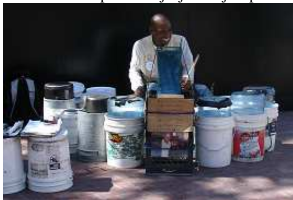
Bubnování na různé pixly a kbelíky znělo docela dobře.