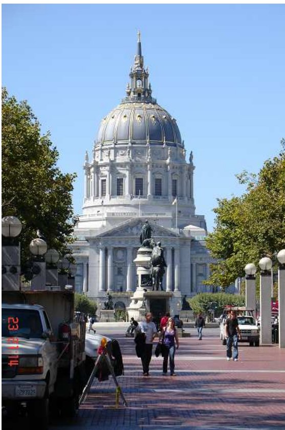
I San Francisco má svůj Kapitol...