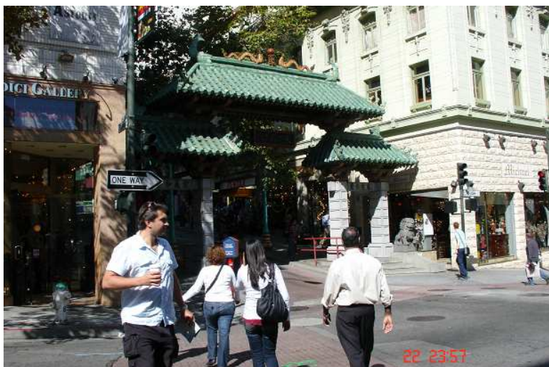
Vstupní brána do čínské čtvrti China Town.

Ve Friscu je největší čínská čtvrť hned po New Yorku. Tato část města se nám (hlavně Romance ☺) hrozně moc líbila. Kupodivu zde nebyli žádní umaštění somráci, neboť by si ani neměli kam sednout – je tu jeden obchůdek vedle druhého. A v těch obchůdcích se prodává všechno možné, zejména různorodé barevné cetky, trička za dolar, elektronika Sony atd. za zlomek ceny (těžko říct, zda je to originál či ne, když je dnes všechno made in china ) a hlavně všelijaké lahůdky. Potvrdilo se nám, že to co servírují čínské restaurace v ČR je šílený humus, který nemá s asijskou kuchyní nic společného. Zklamáním bylo, že jsme opět nenarazili na žáby – už v New Yorku se měly podle průvodce pyšně nafukovat v každém rybím bufetu a ono nic. Teda chtěla jsem je jen vidět, nikoliv konzumovat ☺.