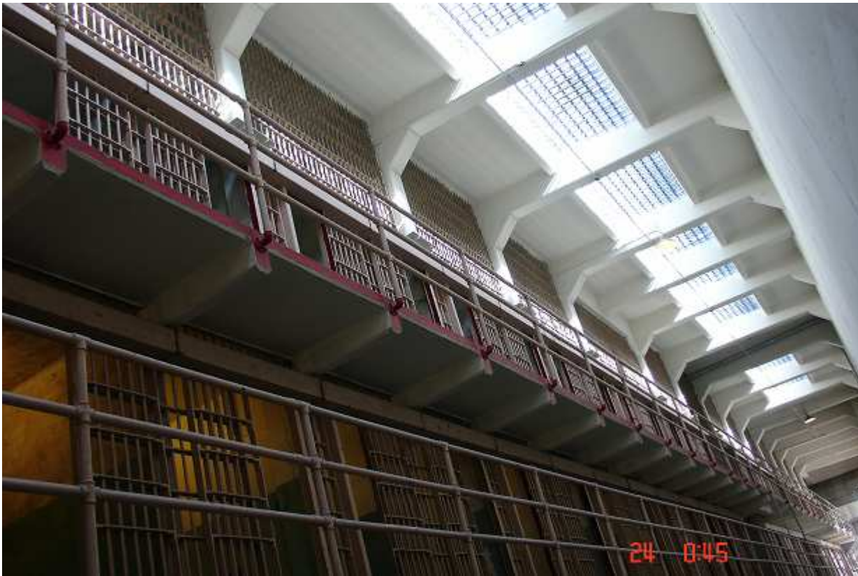
Mrňavé vězeňské cely se táhnou ve dvou patrech nad sebou.