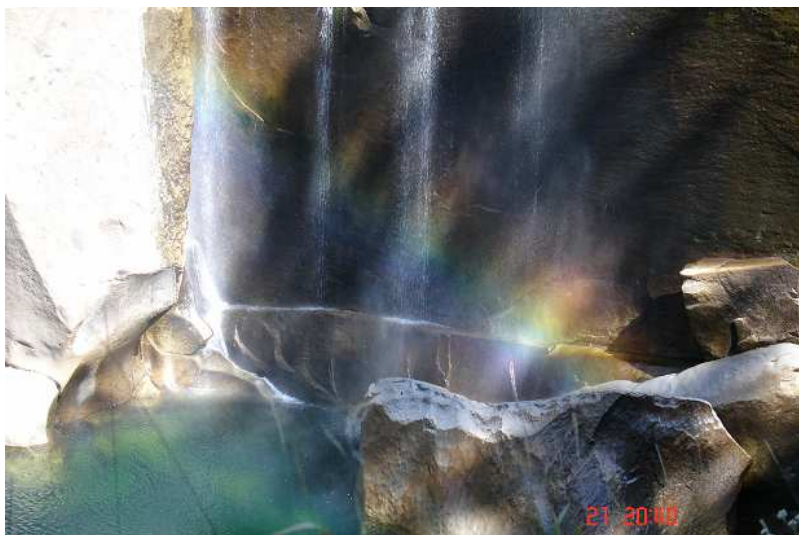
Vodopád Nevada Falls. Na jaře to musí být krásný pohled...