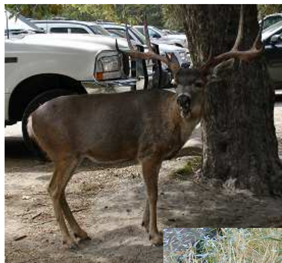
Lesní zvířátka byla opět neobvykle krotká. Buď mají dobrou zkušenost s lidmi, nebo vzteklinu ☺.