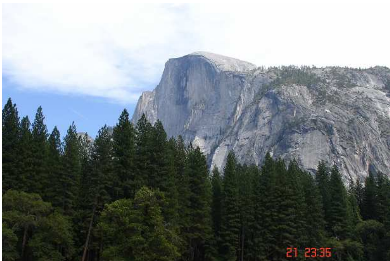
Nejznámější silueta celého parku – Half Dome. Obrovitý žulový dóm s chybějící polovičkou