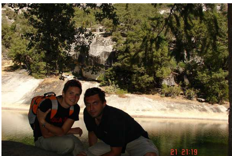
Jezírko Emerald Pool