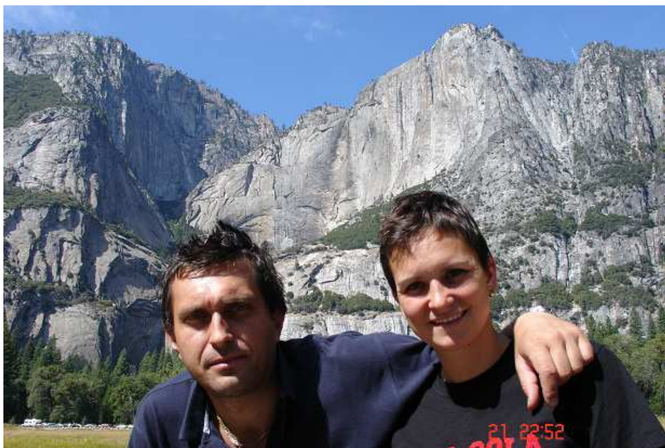
Posíláme pozdrav z Yosemite.