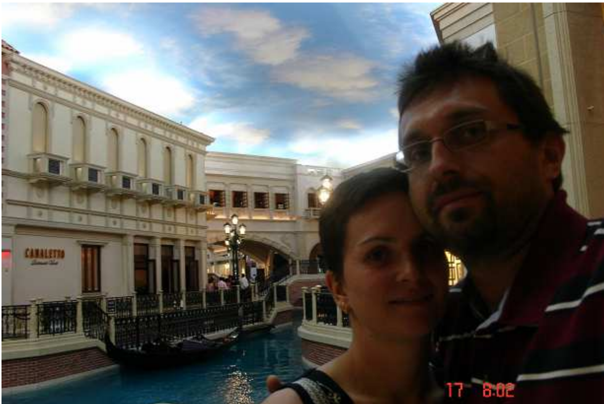
V hotelu Venetian projdete kasinem a ocitnete se v Benátkách uprostřed odpoledne. Procházeli jsme se uličkami, koukali na obchůdky a na modré nebe s bílými mraky a až na náměstí (které bylo velké asi jako v Rychnově) jsme si vzpomněli, že jsme v Americe a venku je noc.