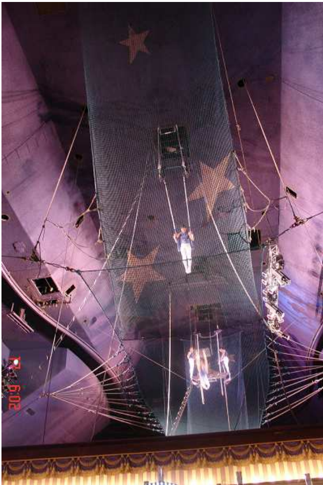
V hotelu Circus Circus se nad hlavami hráčů vysoko u stropu houpou akrobati. Z jejich kousků nám lezl mráz po zádech.