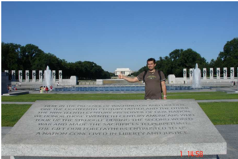
Památník druhé světové války. Vzadu Lincolnův památník, který svou architekturou připomíná řecký antický chrám.