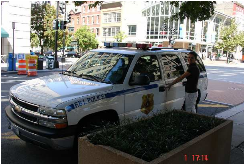
Tak čau, už musím do práce. Zločin nikdy nespí ... ☺.