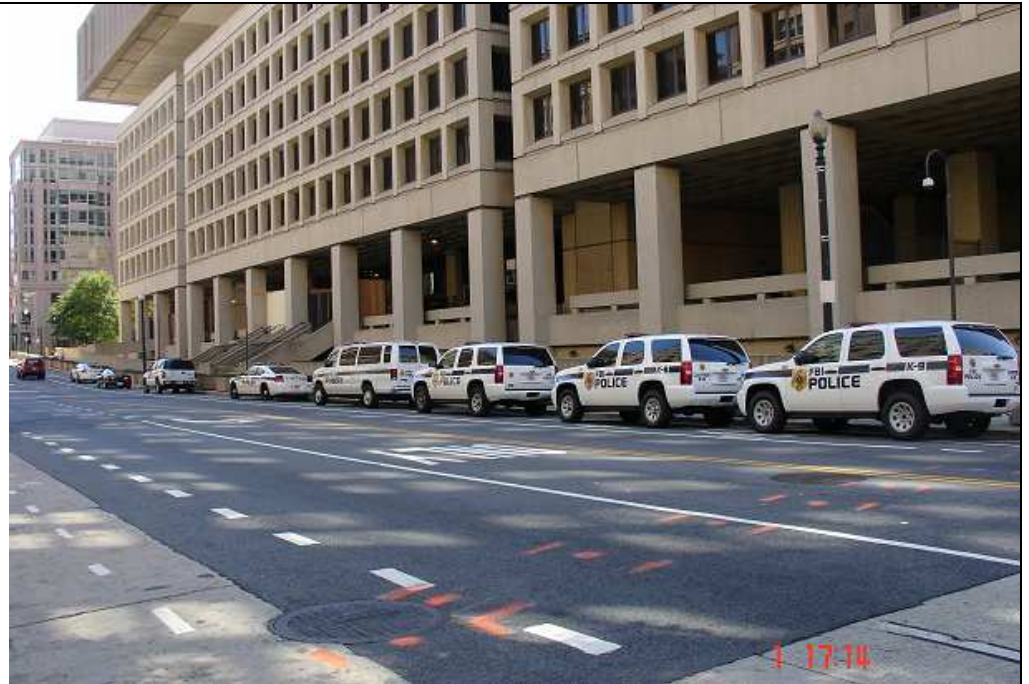
Už sto let pomáhají a chrání ☺