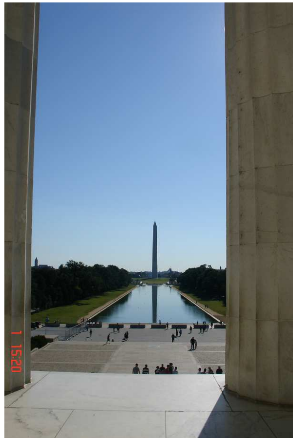
Prezident Abraham Lincoln sedí na židli v Lincolnově památníku, měří 6 metrů a kouká se na 170 metrů vysoký Washingtonův obelisk.