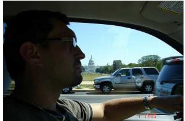
Tak to je naše krásné nové autíčko Chevrolet Trail Blazer (automat, 4,2 litrů, řadový 6ti válec), kterým dnes frčíme do Washingtonu a pak dál do Great Smoky Mountains.

Dnes je v USA svátek práce, takže ve Washingtonu bylo málo lidí. Nebo to taky možná bylo tím, že se tu musí hodně chodit a je tu málo jezdících schodů a podlah ☺ a neprodávají se tu hamburgery na každém rohu. Nám se tu ale v té spoustě zeleně po víkendovém newyorském shonu moc líbilo. Washington je město parků, muzeí a památek. Skoro nikde se neplatí vstupné.