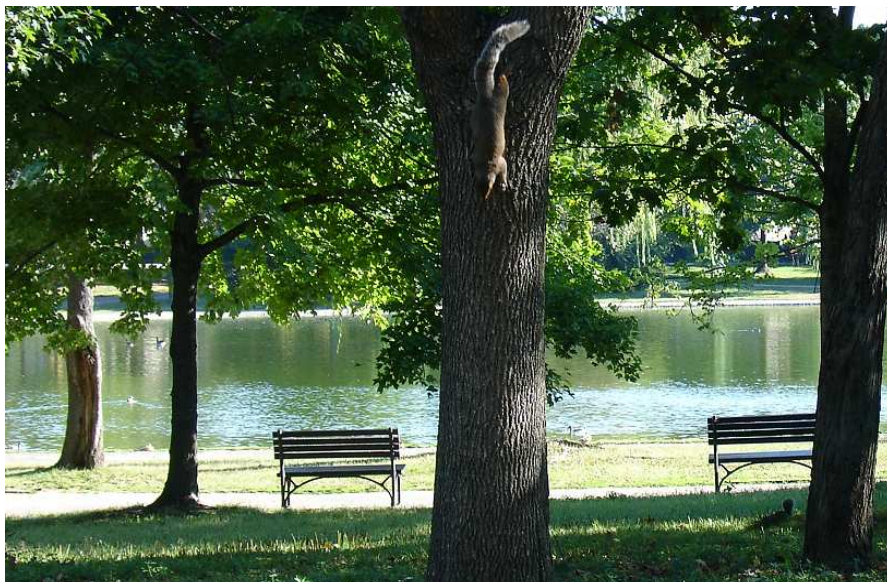
I ve Washingtonu bydlí krásné veverky!