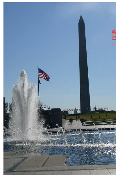
Washingtonův památník (170 metrů vysoký jehlan z bílého mramoru) je pro obyvatele Washingtonu něco jako Socha svobody pro Newyorčany. Není šikmý jako šikmá věž v Pise, to nám jenom fouknul vítr do foťáku ☺.